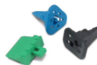
TE 产品编号W2S Wedgelocks: DEUTSCH DT