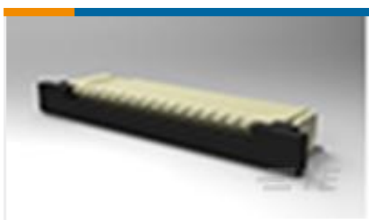
TE 产品编号2-84953-0 1MM FPC HORZ.TOP CONT.ASSY 20P