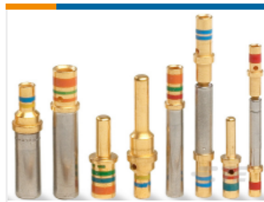
TE 产品编号4160-203-1631L CONT PIN