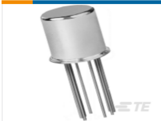
TE 产品编号8-1617350-3 J1MAC-12XP=M39016/7-028P