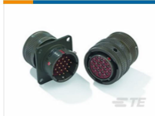
TE 产品编号ZPF000000000122869 951-00 R 18-800 P 50-090