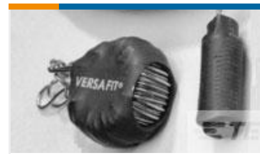
TE 产品编号F27156-000 VERSAFIT-MINI-SPL-1-BK