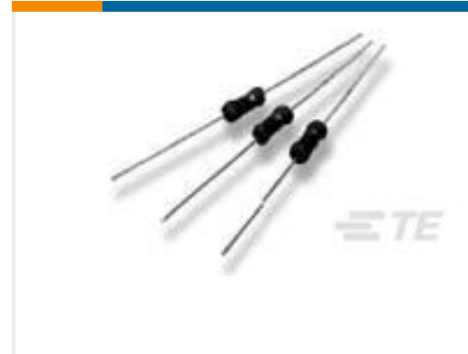
TE 产品编号8-1879350-9 RR01 5% 1K0 AMMO