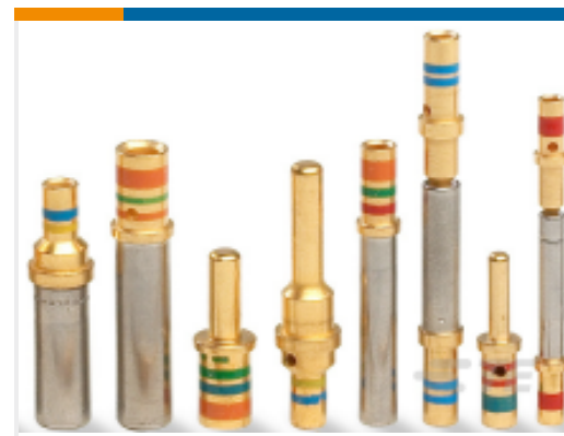
TE 产品编号4162-201-1631L CONT SOC ASSY