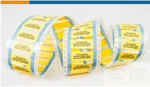
TE 产品编号9246090001 TMS-SCE-1/8-2.0-S1-9