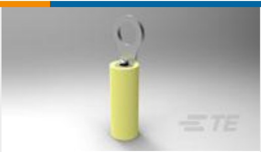
TE 产品编号329951 TERMINAL,PIDG R 26-22 2