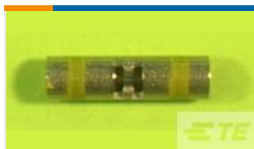
TE 产品编号680330-000 D-609-10