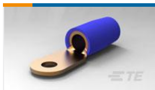
TE 产品编号324046 TERMINAL, T-N R 6 10