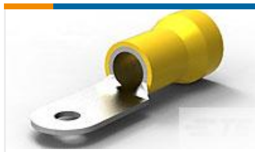
TE 产品编号52043 TERMINAL,R PG 4 10