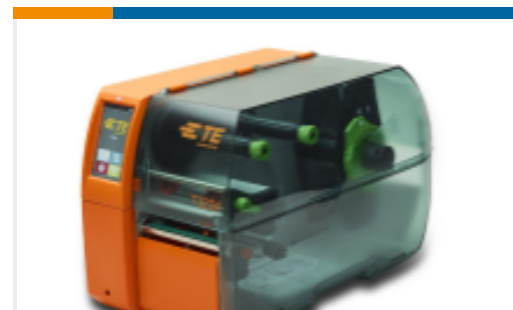
TE 产品编号1-2186502-1 T3224-PRINTER