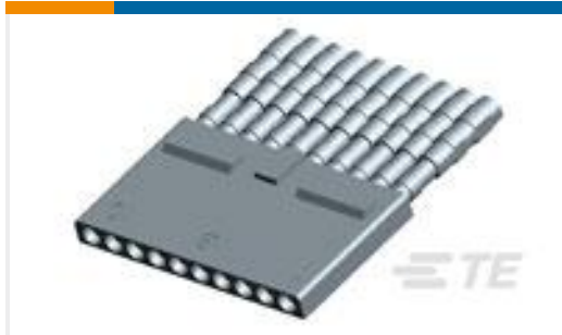
TE 产品编号697119-000 MTC100-JB1-S14