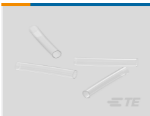
TE 产品编号5960032024 TFER-1/4-X-CS-34034