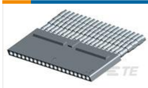
TE 产品编号697123-000 MTC100-JB2-S14