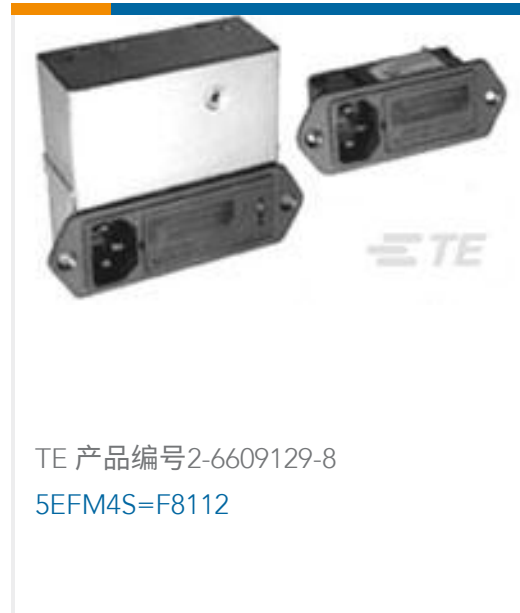
TE 产品编号2-6609129-8 5EFM4S=F8112