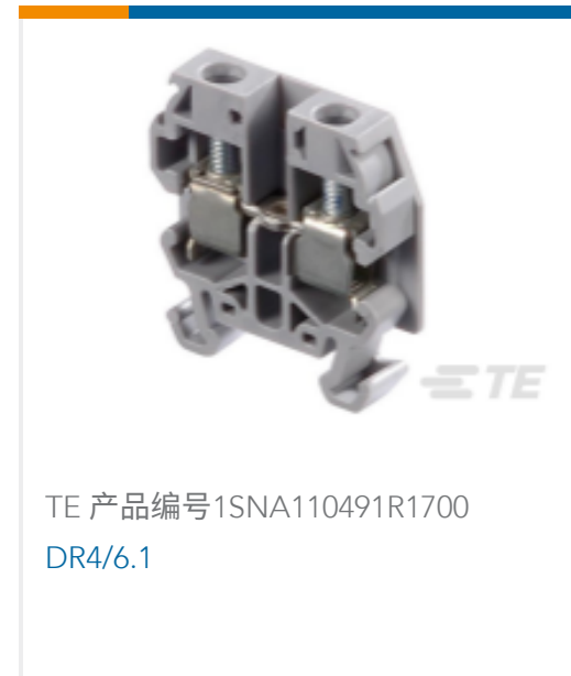
TE 产品编号1SNA110491R1700 DR4/6.1