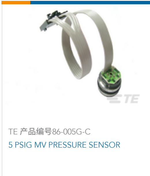
TE 产品编号86-005G-C 5 PSIG MV PRESSURE SENSOR