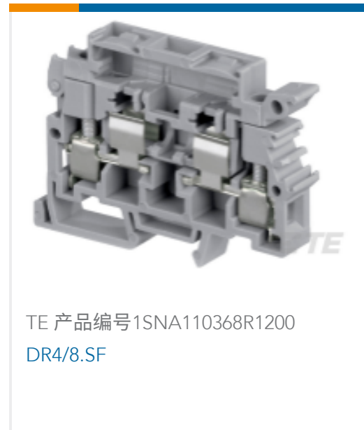
TE 产品编号1SNA110368R1200 DR4/8.SF