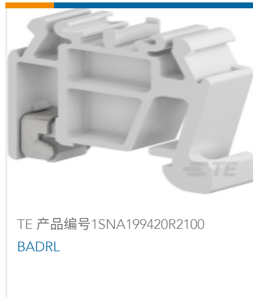
TE 产品编号1SNA199420R2100 BADRL