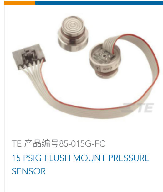
TE 产品编号85-015G-FC 15 PSIG FLUSH MOUNT PRESSURE SENSOR