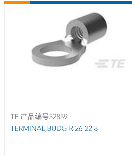
TE 产品编号32859 TERMINAL, BUDG R 26-22 8