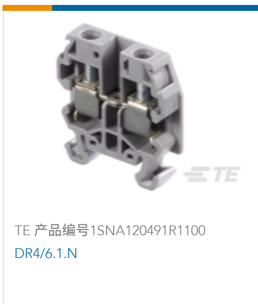
TE 产品编号1SNA120491R1100 DR4/6.1.N