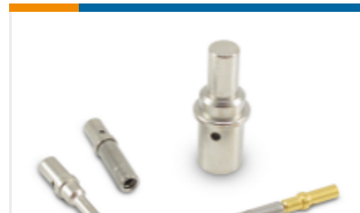
TE 产品编号0462-209-16141 DEUTSCH Solid Contacts