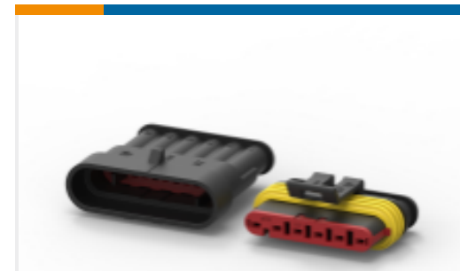
TE 产品编号282087-1 AMP SUPERSEAL 1.5MM , 连接器壳体