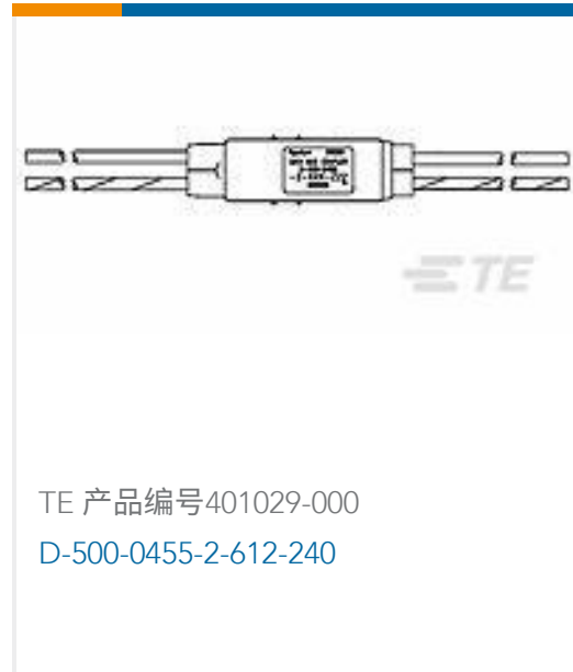
TE 产品编号401029-000 D-500-0455-2-612-240