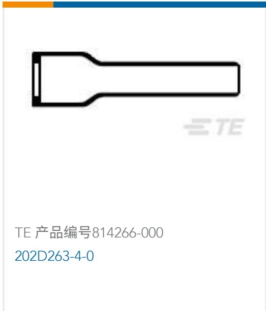
TE 产品编号814266-000 202D263-4-0