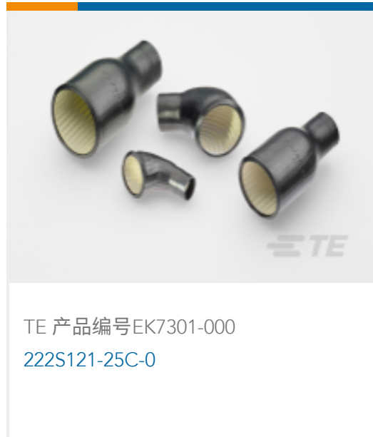
TE 产品编号EK7301-000 222S121-25C-0