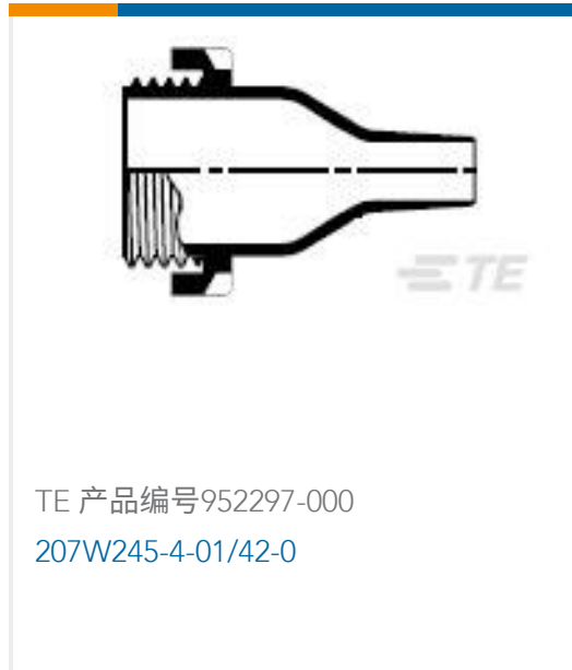
TE 产品编号952297-000 207W245-4-01/42-0