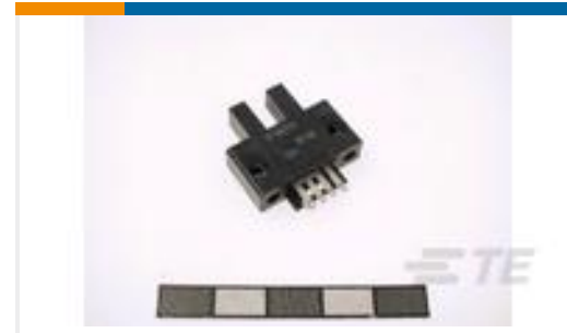
TE 产品编号7-547605-4 FORKED PHOTO ELECTRIC BARRIER