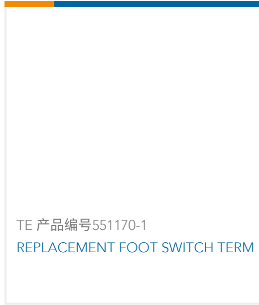
TE 产品编号551170-1 REPLACEMENT FOOT SWITCH TERM