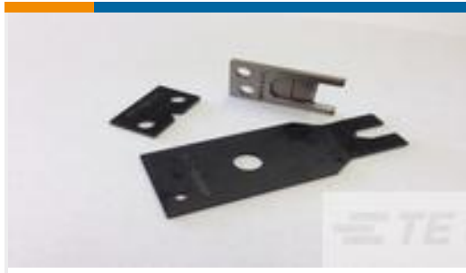
TE 产品编号1633338-2 BLADE, SLUG