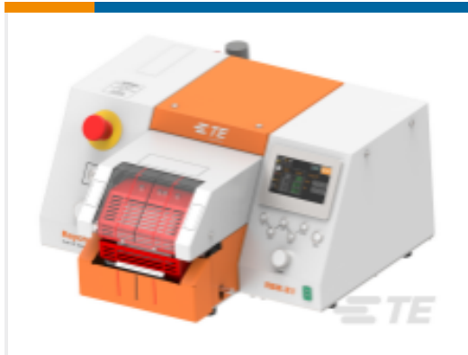
TE 产品编号 1-2234800-4 RBK-X1 CE, W/ AIR COOLING