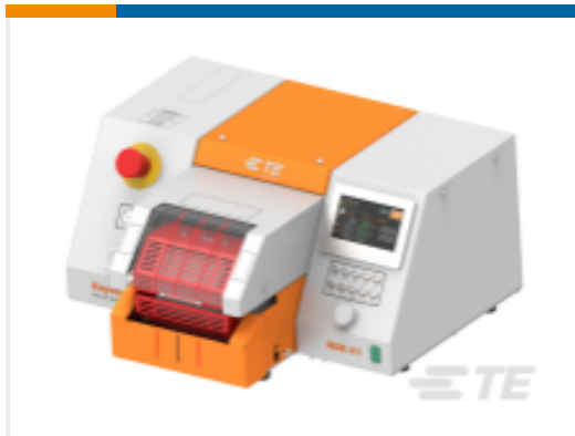
TE 产品编号 2234800-2 RBK-X1 CE STD