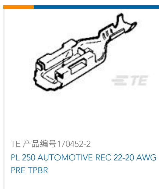
TE 产品编号170452-2 PL 250 AUTOMOTIVE REC 22-20 AWG PRE TPBR