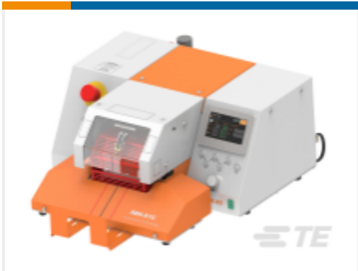
TE 产品编号 1-2376800-4 RBK-X1C CE, W/ AIR COOLING