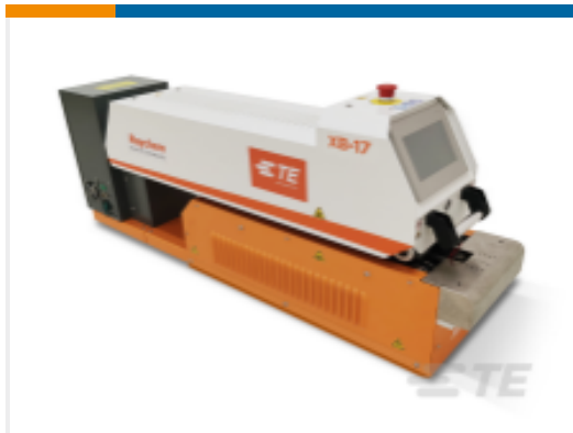
TE 产品编号 2375310-2 XB17 Belt Heater, 110V