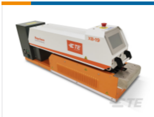
TE 产品编号 2375320-2 XB19 Belt Heater, 150mm (6") Version