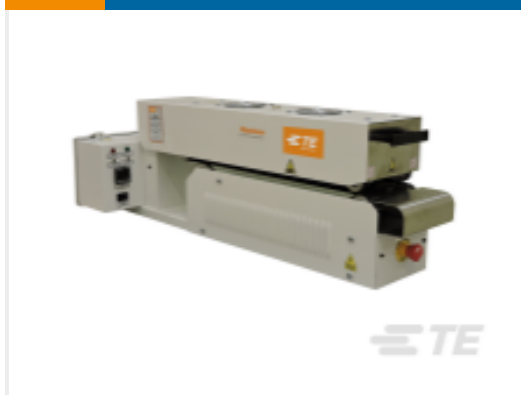
TE 产品编号 2280355-1 220 V MODEL 17