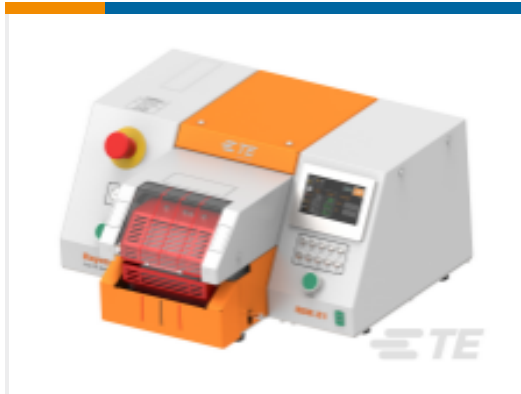
TE 产品编号 2234800-1 RBK-X1 STD