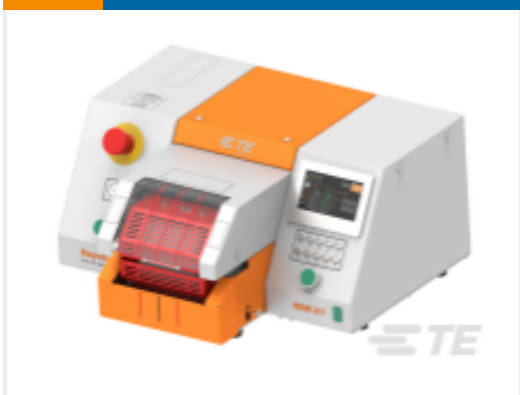
TE 产品编号 1-2234800-1 RBK-X1, AUTO TRIGGER