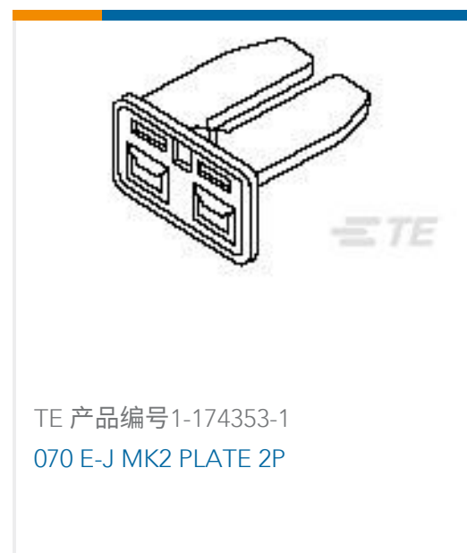
TE 产品编号1-174353-1 070 E-J MK2 PLATE 2P