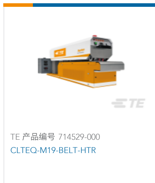
TE 产品编号 714529-000 CLTEQ-M19-BELT-HTR