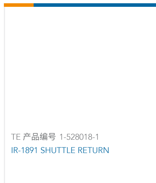
TE 产品编号 1-528018-1 IR-1891 SHUTTLE RETURN