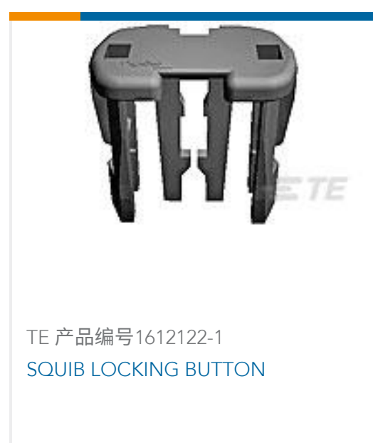
TE 产品编号1612122-1 SQUIB LOCKING BUTTON