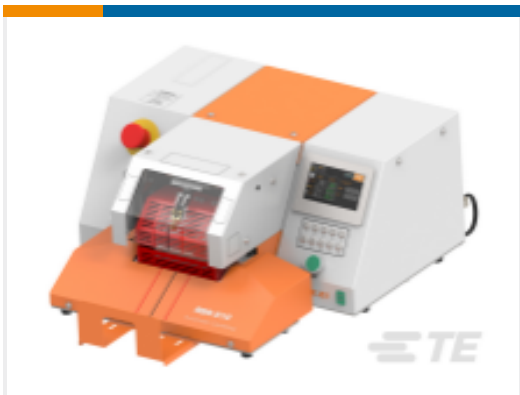
TE 产品编号 2376800-1 RBK-X1C STD