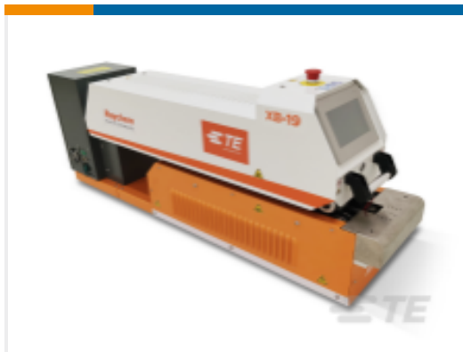
TE 产品编号 2375320-1 XB19 Belt Heater, STD