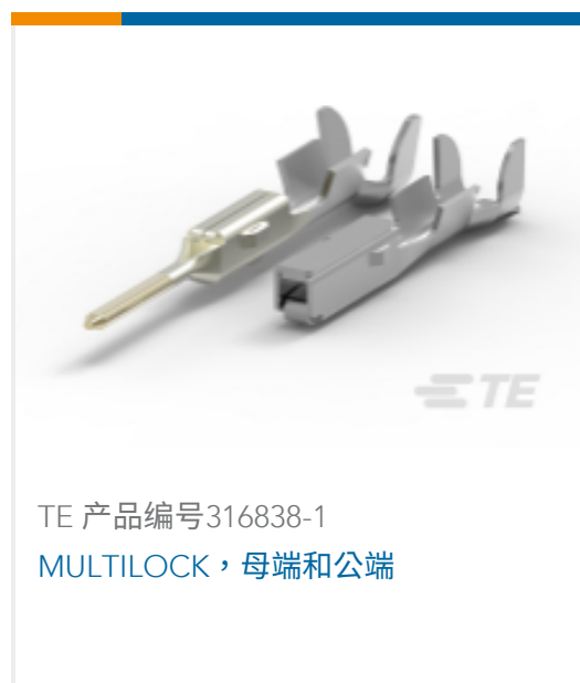
TE 产品编号316838-1 MULTILOCK, 母端和公端