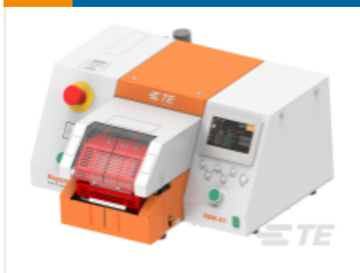
TE 产品编号 1-2234800-3 RBK-X1, W/ AIR COOLING