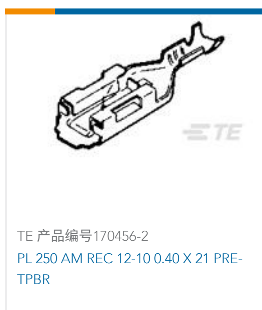
TE 产品编号170456-2 PL 250 AM REC 12-10 0.40 X 21 PRE-TPBR