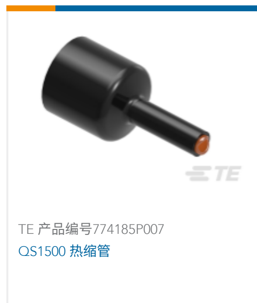
TE 产品编号774185P007 QS1500 热缩管