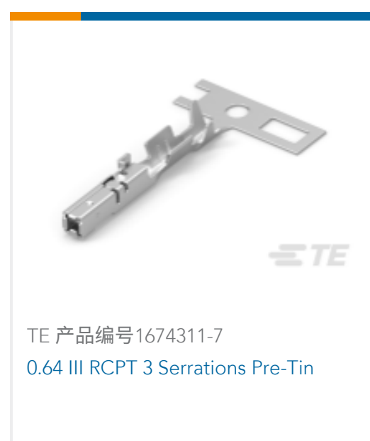
TE 产品编号1674311-7 0.64 III RCPT 3 Serrations Pre-Tin