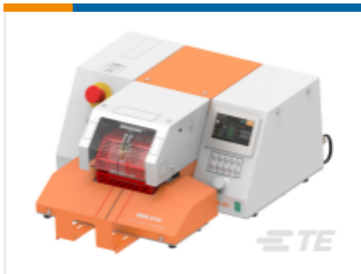
TE 产品编号 2376800-2 RBK-X1C CE STD