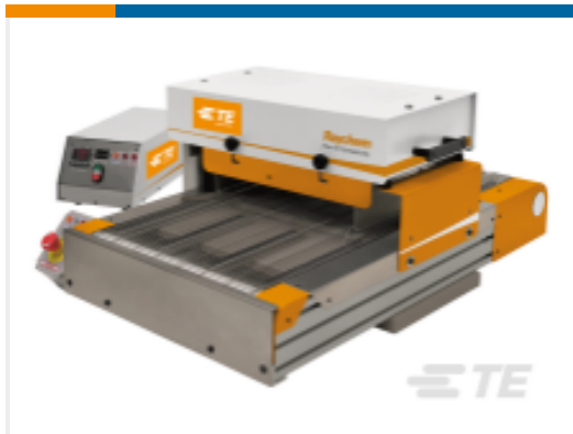
TE 产品编号 2326489-1 MODEL 105 TUNNEL OVEN, 36" ENTRY, STAND A