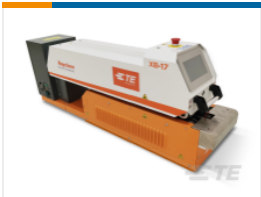
TE 产品编号 2375310-1 XB17 Belt Heater, 220V