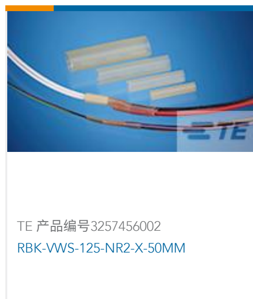
TE 产品编号3257456002 RBK-VWS-125-NR2-X-50MM