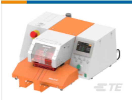
TE 产品编号 1-2376800-3 RBK-X1C, W/ AIR COOLING