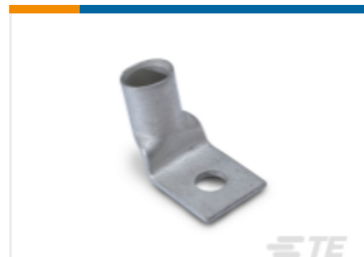
TE 产品编号696391-1 AMPOWER 端子 90 度弯曲