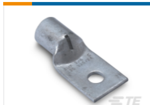
TE 产品编号326106 AMPOWER 端子 1 个螺钉孔