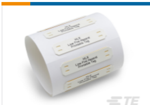
TE 产品编号EE0111-000 HLX 低火灾隐患标志