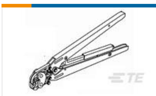
TE 产品编号47689 DAHT F TYPE 14-12 ASSY