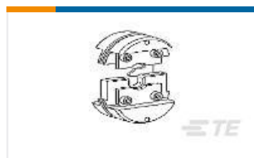
TE 产品编号1583097-1 DIE ASSY, AMPOWER, 3/0