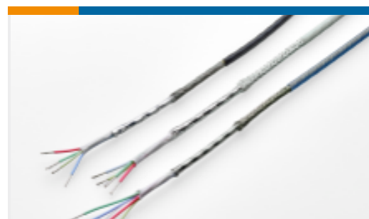
TE 产品编号CW8337-000 THX-24C112-811-0