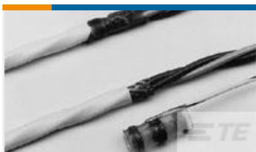
TE 产品编号CR0181-000 CWT-11-W116-9