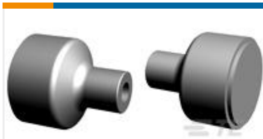
TE 产品编号 85024-1 RUBBER PLUG GRAY FOR 187 SEALD