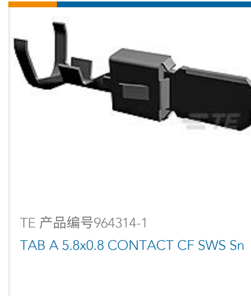
TE 产品编号964314-1 TAB A 5.8x0.8 CONTACT CF SWS Sn