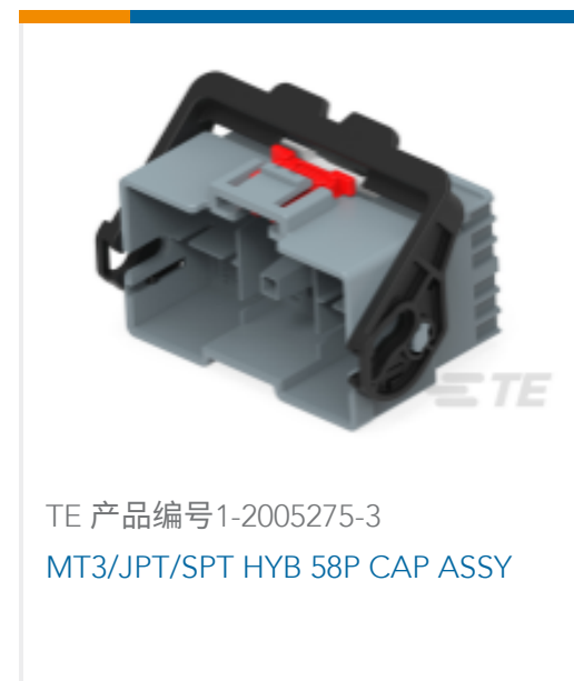
TE 产品编号1-2005275-3 MT3/JPT/SPT HYB 58P CAP ASSY