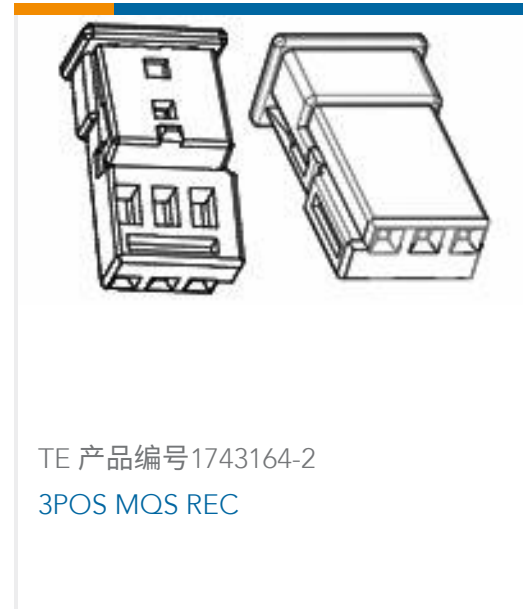
TE 产品编号1743164-2 3POS MQS REC