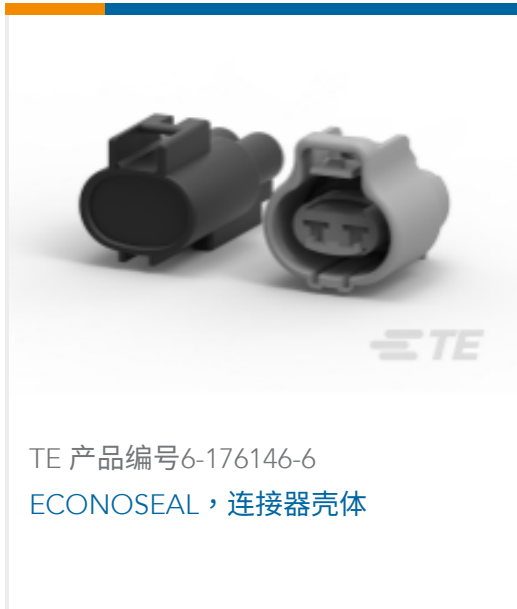
TE 产品编号6-176146-6 ECONOSEAL, 连接器壳体