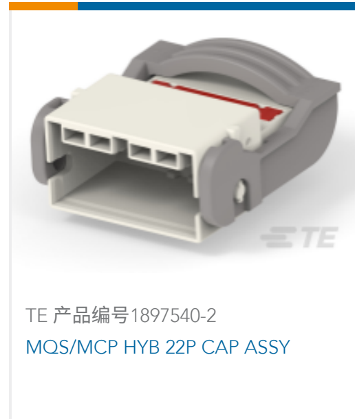
TE 产品编号1897540-2 MQS/MCP HYB 22P CAP ASSY