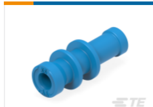
TE 产品编号 2377665-4 SWS, DIA 3MM, CVTY DIA, 3-2.6MM, BLU