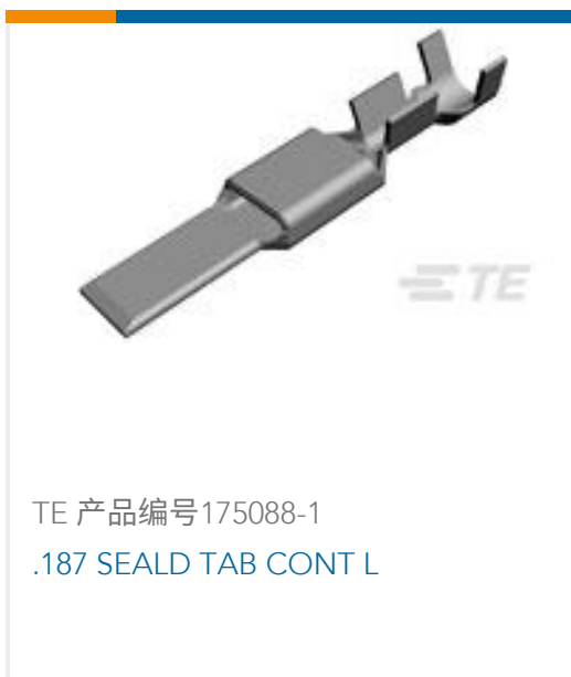
TE 产品编号175088-1 .187 SEALD TAB CONT L