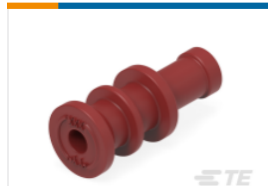
TE 产品编号 2377665-3 CVTY PLUG, DIA 3MM, CVTY DIA, 3.0-2.6MM, BRN