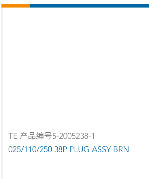
TE 产品编号5-2005238-1 025/110/250 38P PLUG ASSY BRN