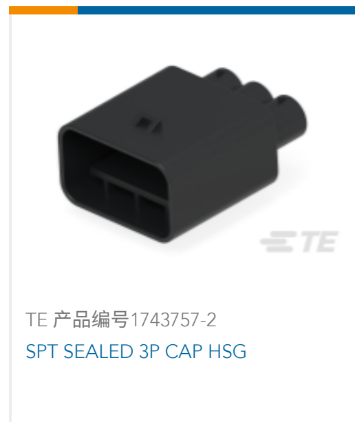
TE 产品编号1743757-2 SPT SEALED 3P CAP HSG