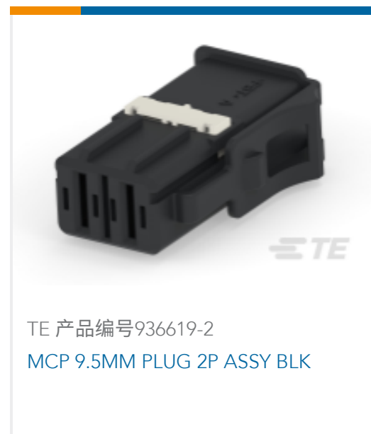
TE 产品编号936619-2 MCP 9.5MM PLUG 2P ASSY BLK