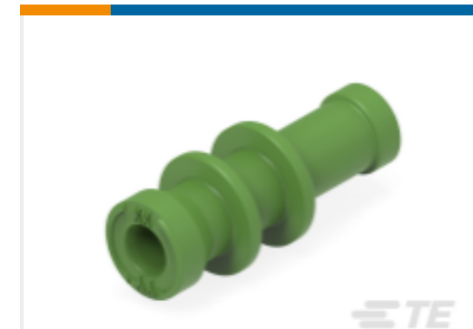
TE 产品编号 2377665-5 SWS, 0.64 SERIES, CVTY DIA, 3.0-2.6, GRN