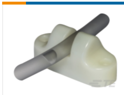
TE 产品编号10217758-00 ABD,AD-101,COMPACT ASSY,6MM