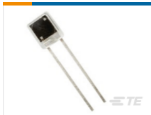
TE 产品编号20-0696 DETECTOR ASSY 8.07 SQMM