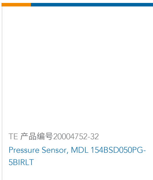
TE 产品编号20004752-32 Pressure Sensor, MDL 154BSD050PG- 5BIRLT