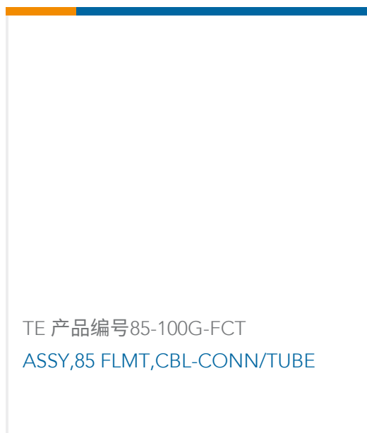
TE 产品编号85-100G-FCT ASSY,85 FLMT,CBL-CONN/TUBE