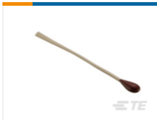
TE 产品编号11028086-00 DISC-DISCRETE