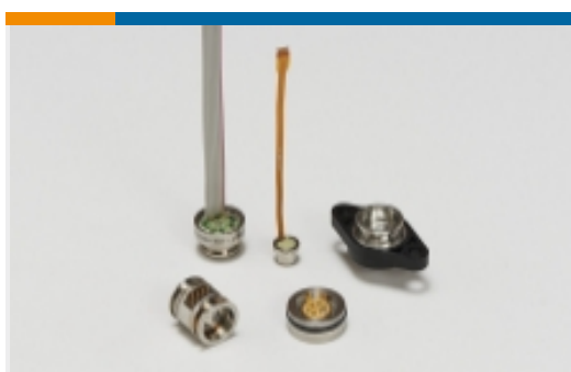
介质隔离压力传感器(42)