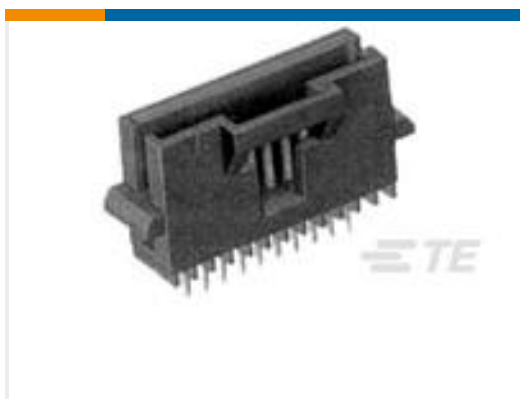
TE 产品编号5-104071-4 20 SYSTEM 50 HDR SRST SHRD SN