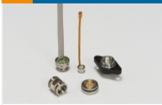
介质隔离压力传感器(42)