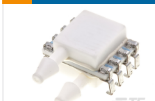
TE 产品编号4515-DS5A005GP PRESS XDCR, ANALOG, INH20 RANGE