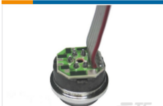
TE 产品编号85-300G-4R 300 PSIG 1/4 - 18 NPT RIBBON PRESS SENSOR