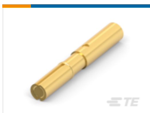
TE 产品编号60-0278-011-000 CONTACT SOCKET 0.6 MM