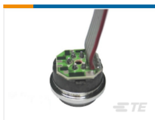
TE 产品编号85-100A-0R 100 PSIA WELDABLE PRESSURE SENSOR