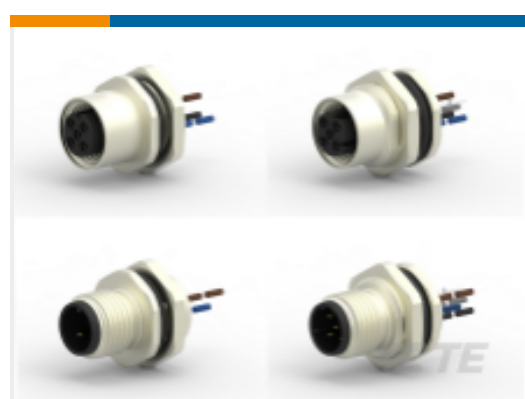
TE 产品编号T4171310005-001 M12 面板安装导线