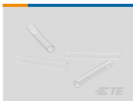
TE 产品编号NB15982001 RT-375-1/4-X-STK