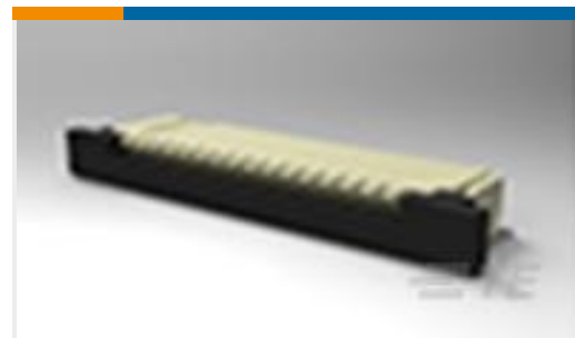
TE 产品编号 84953-7 1MM FPC HORZ.TOP CONT.ASSY 7P