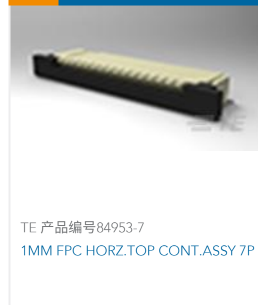
TE 产品编号84953-7 1MM FPC HORZ.TOP CONT.ASSY 7P