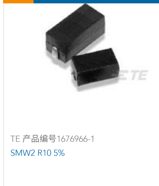
TE 产品编号1676966-1 SMW2 R10 5%