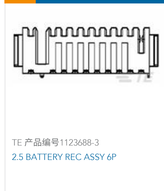
TE 产品编号1123688-3 2.5 BATTERY REC ASSY 6P