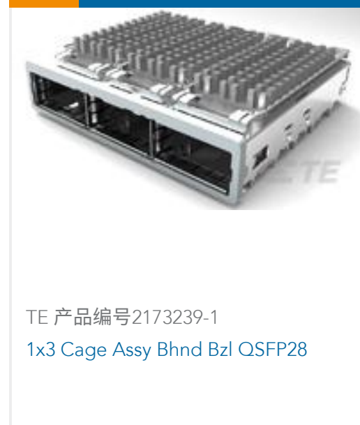
TE 产品编号2173239-1 1x3 Cage Assy Bhnd Bzl QSFP28