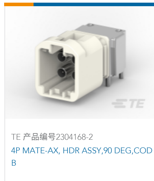
TE 产品编号2304168-2 4P MATE-AX, HDR ASSY,90 DEG,COD B