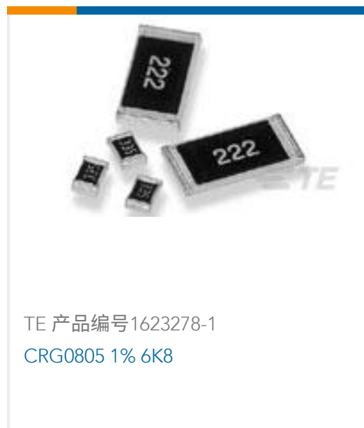
TE 产品编号1623278-1 CRG0805 1% 6K8