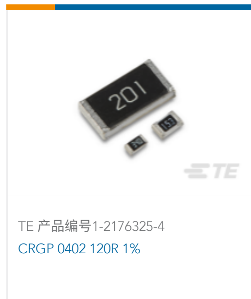
TE 产品编号1-2176325-4 CRGP 0402 120R 1%