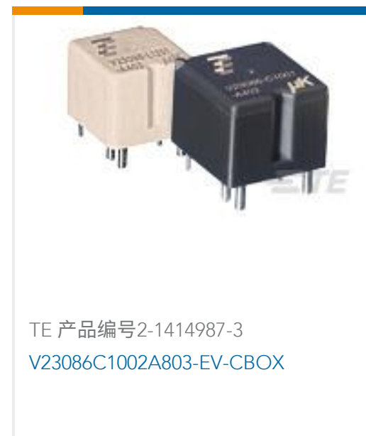
TE 产品编号2-1414987-3 V23086C1002A803-EV-CBOX