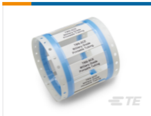
TE 产品编号245965-000 TMS-SCE Military Grade Sleeves