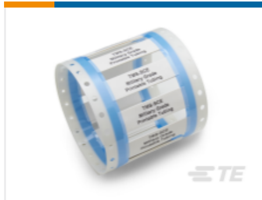
TE 产品编号245965-000 TMS-SCE Military Grade Sleeves