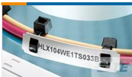
TE 产品编号EC7654-000 HLX203YW1TS050B