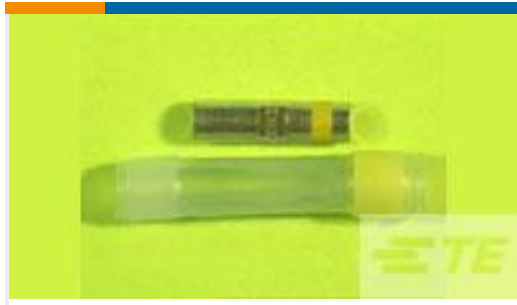
TE 产品编号 650075-000 D-436-37