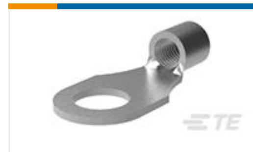
TE 产品编号321827 TERMINAL, SOLIS R 14-12 8