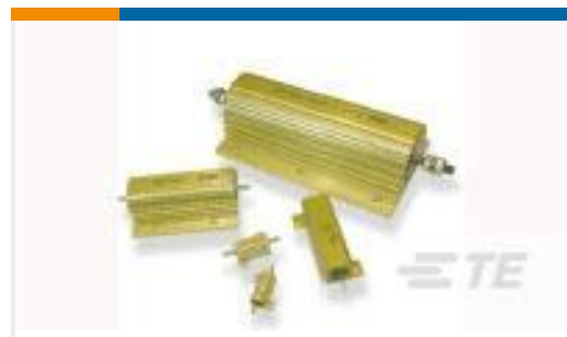
TE 产品编号1-1625999-4 HSC100 1R0 5%