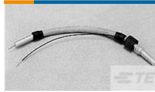
TE 产品编号1-862545-0 LEAD, SGL END ASSY, LGH