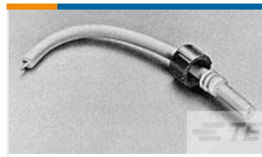
TE 产品编号3-830611-5 LGH 1/2 SGL MLD END