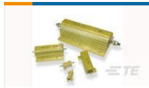
TE 产品编号2-1630019-7 HSC200 R10 5%