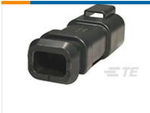
TE 产品编号DT04-4P-CE09 REC, 4P, BLK, E, XCAP