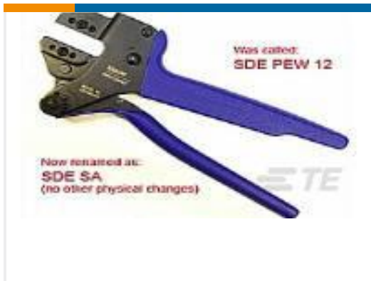
TE 产品编号2063438-1 SDE UMNL 1.5-2.5mm2 ASSY