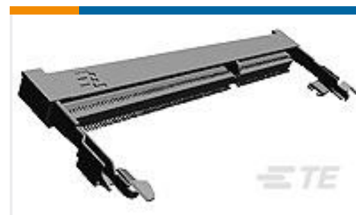
TE 产品编号2-2013289-1 EMBOSS TAPE DDR3 204P 5.2H STD