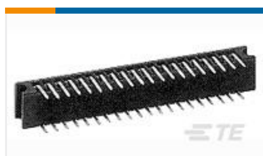
TE 产品编号532956-6 36 MODII 2PC CE RCPT ASSY