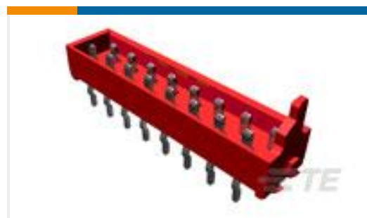
TE 产品编号2-215464-0 20P.MICRO-MATCH MOB