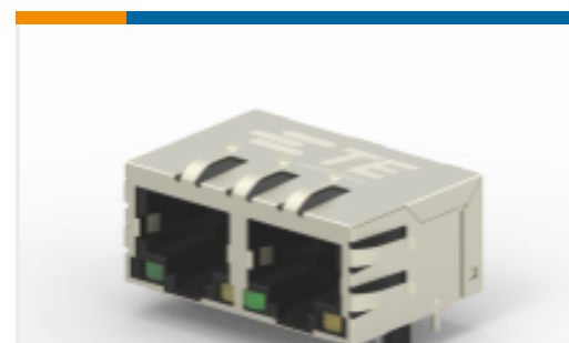
TE 产品编号2301996-8 RJ45 JACK INT.MAG. 1GB LED 1X2