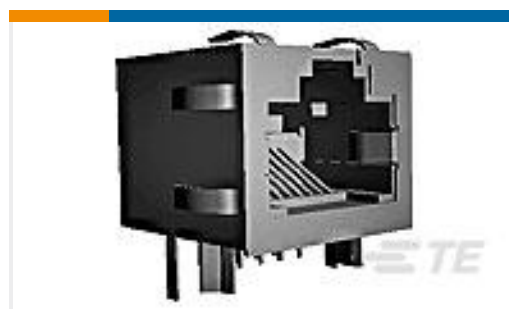
TE 产品编号1-406541-5 MJ, INV, 1X1, 0PNL G., .100" ST, SN