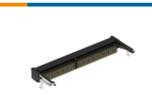
TE 产品编号2309413-1 DDR4 SODIMM 260P 9.2H STD