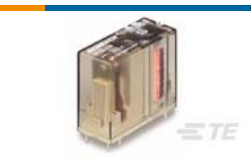
TE 产品编号1393230-9 RP3SL012