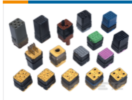
TE 产品编号 ZPF000000000202094 DMC-M 0402 AW 01