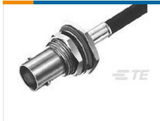
TE 产品编号 225398-6 CONNECTOR, BNC DUAL CRIMP JACK