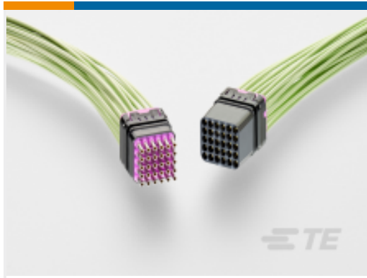
TE 产品编号 ZPF000000000203399 DMC-MR 30-23 PD