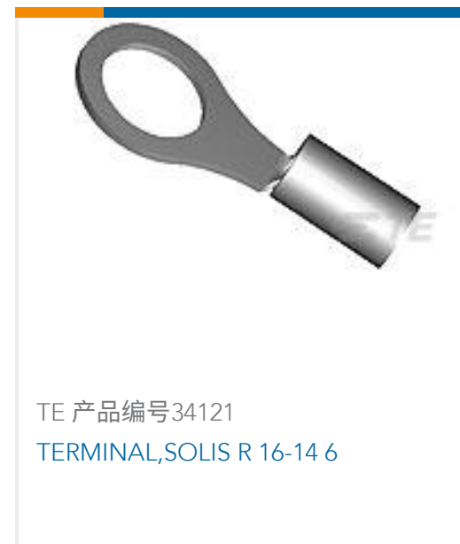
TE 产品编号34121 TERMINAL,SOLIS R 16-14 6