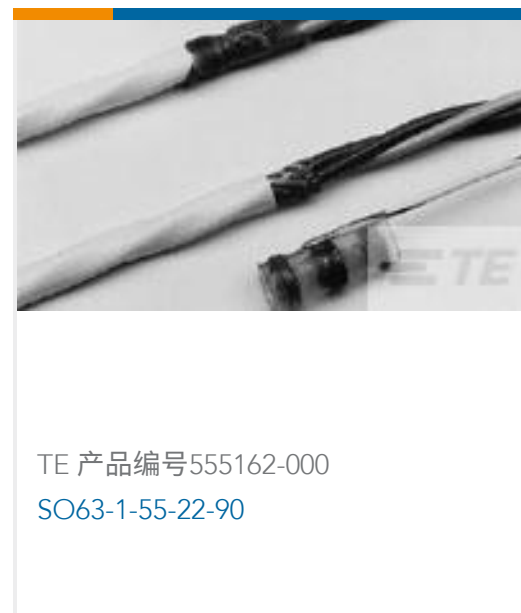
TE 产品编号555162-000 SO63-1-55-22-90