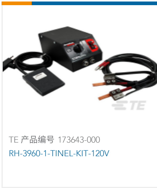
TE 产品编号 173643-000 RH-3960-1-TINEL-KIT-120V