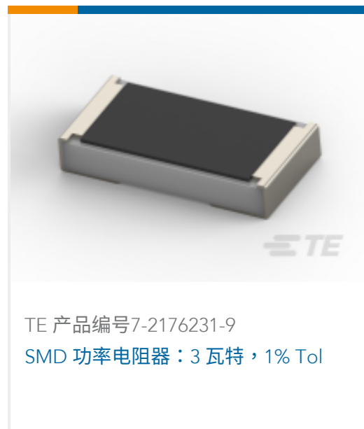
TE 产品编号7-2176231-9 SMD 功率电阻器：3 瓦特，1% Tol