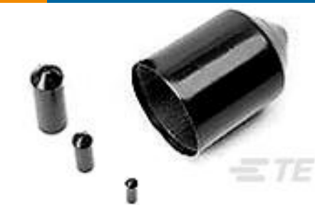
TE 产品编号 843056-000 101A073-3-0