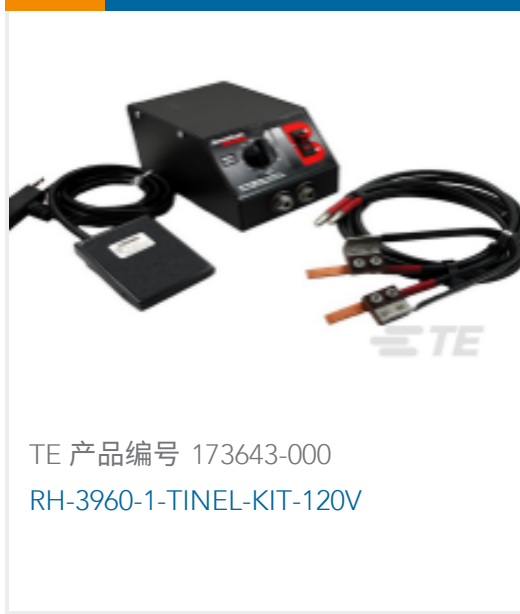
TE 产品编号 173643-000 RH-3960-1-TINEL-KIT-120V