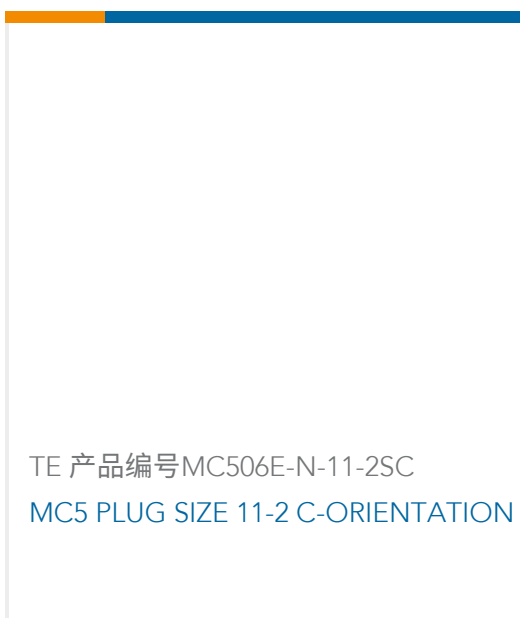
TE 产品编号MC506E-N-11-2SC MC5 PLUG SIZE 11-2 C-ORIENTATION