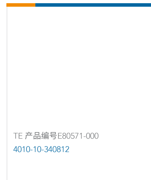
TE 产品编号E80571-000 4010-10-340812