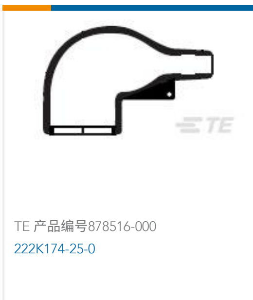
TE 产品编号878516-000 222K174-25-0