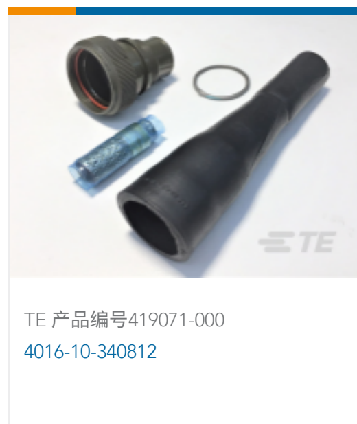
TE 产品编号419071-000 4016-10-340812