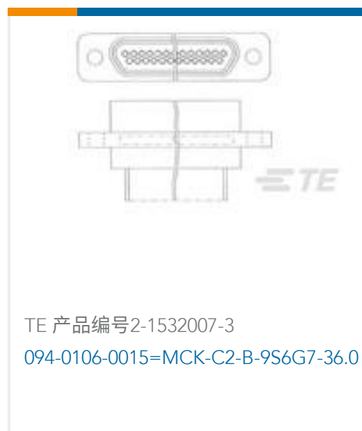
TE 产品编号2-1532007-3 094-0106-0015=MCK-C2-B-9S6G7-36.0