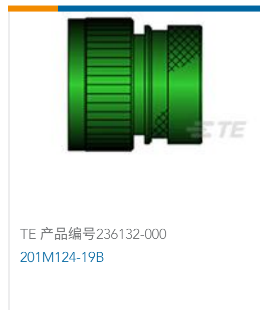
TE 产品编号236132-000 201M124-19B