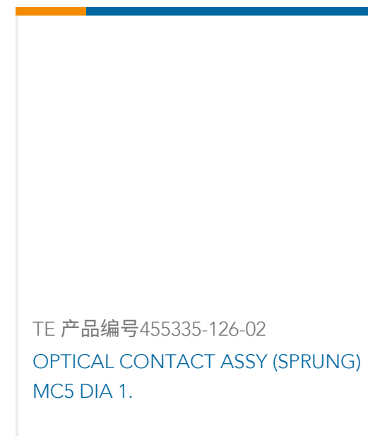
TE 产品编号455335-126-02 OPTICAL CONTACT ASSY (SPRUNG) MC5 DIA 1.