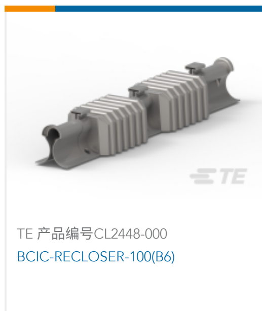
TE 产品编号CL2448-000 BCIC-RECLOSER-100(B6)