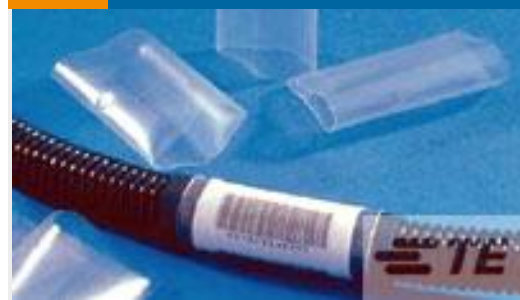
TE 产品编号7343816001 TMS-CCUV-SLEEVE-2-X-65MM