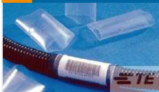
TE 产品编号6209416001 TMS-CCUV-SLEEVE-4-X-65MM