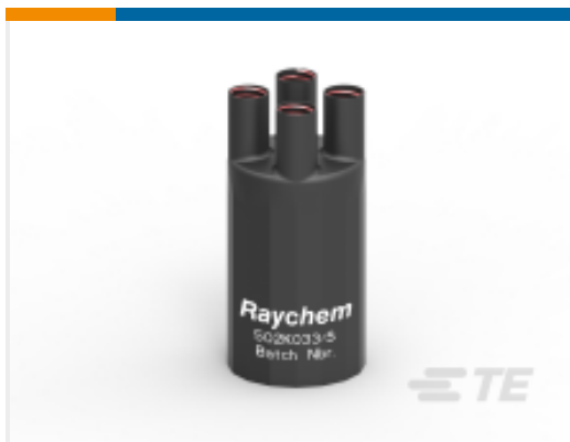
TE 产品编号E00553N001 502K033/S(S15)