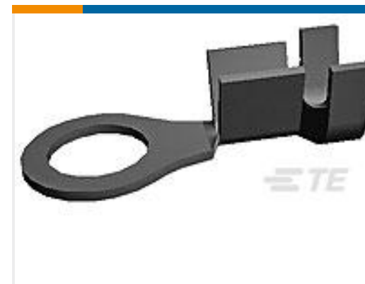
TE 产品编号170225-1 RING TERMINAL