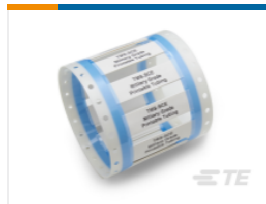
TE 产品编号245965-000 TMS-SCE Military Grade Sleeves