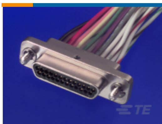
TE 产品编号1-1532185-2 M83513/03-G16N, MCKS-N1-B-51P6Q9-72.0