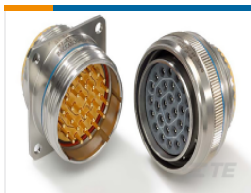
TE 产品编号ZPF000000000007559 983-0SE 14-04 PN-L-A1263