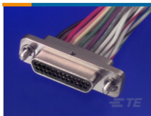
TE 产品编号 1532184-8 M83513/03-F12N, MCKS-N1-B-37P6Q9-36.0