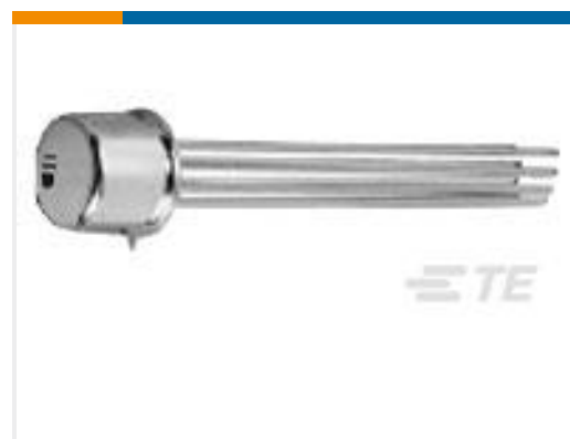
TE 产品编号7-1617547-2 MSPD-26=MSD T05 DIODE RELAY