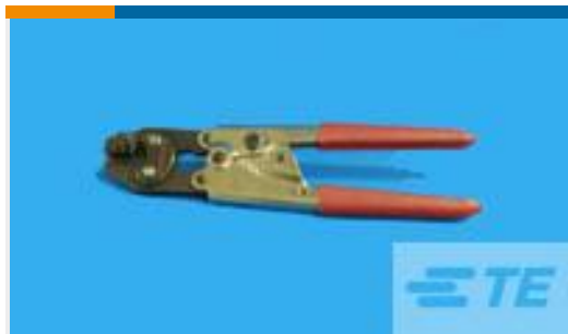
TE 产品编号994855-000 AD-1377-103-CRIMP-LOCATOR