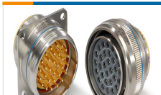
TE 产品编号ZPF000000000008077 983-6K 10-05 SN-L