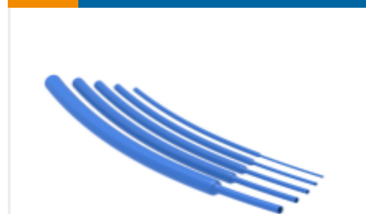
TE 产品编号NB19202001 RNF-100-1/8-BU-STK