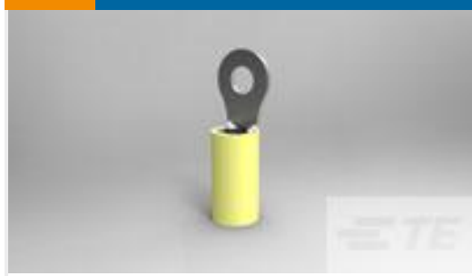
TE 产品编号2-320568-2 TERM, RT, PIDG IR, 12, #8