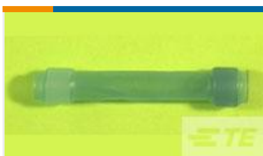
TE 产品编号650071-000 D-436-41