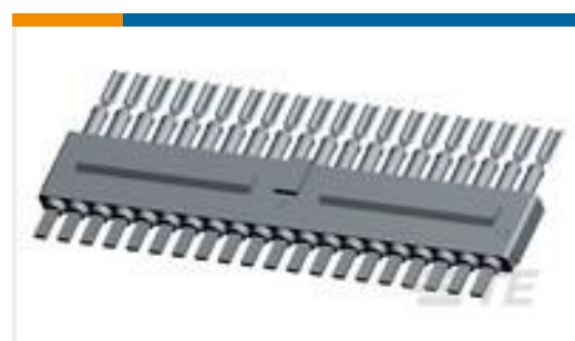
TE 产品编号699219-000 MTCB2X-XXX-205