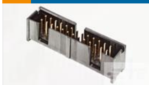
TE 产品编号5103308-2 A/L LOW PRO HDR 14P VERT BLACK