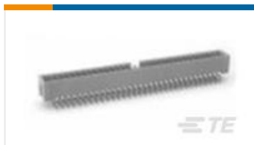
TE 产品编号2-1761605-9 IDC LOW PRO HDR 26P RA BLUE