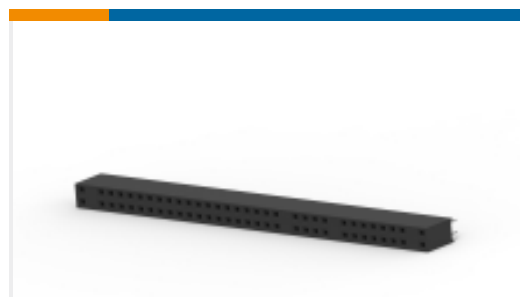
TE 产品编号2271089-1 AMPMODU, REC HDR, 2.54,TH,S,H8. 5. 10U'AU