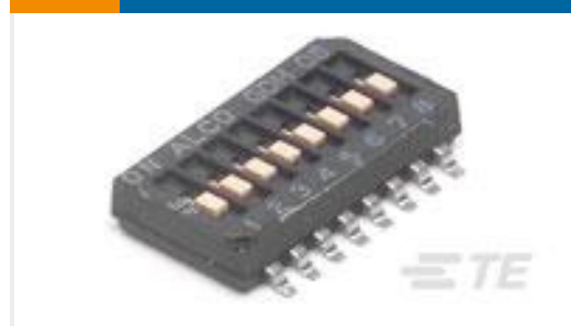
TE 产品编号1571983-9 GDH06STR04=DIP SWITCH