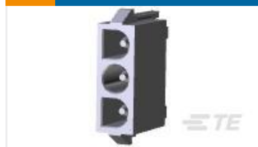
TE 产品编号641965-1 03P UMNL PIN HDR ASSY V2 NATL