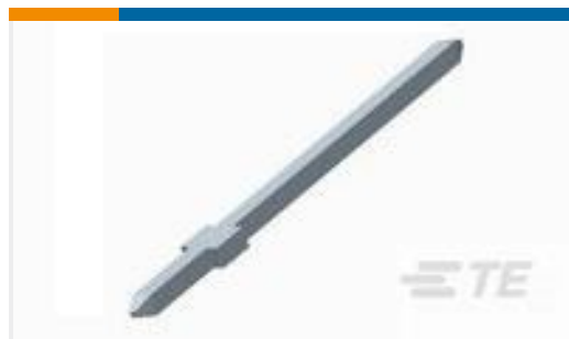
TE 产品编号1-928836-2 MOD2 PIN WITH A-PIN L/P