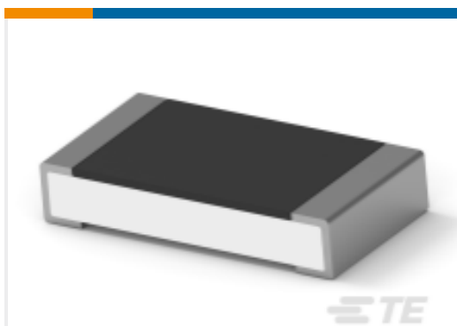
TE 产品编号4-2176391-7 RQ 1206 37K4 0.1% 10PPM 5K RL