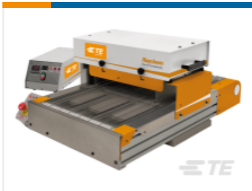
TE 产品编号 2326489-1 MODEL 105 TUNNEL OVEN, 36" ENTRY, STAND