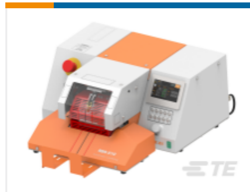
TE 产品编号 2376800-2 RBK-X1C CE STD