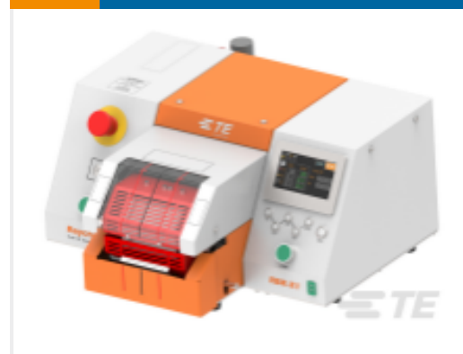
TE 产品编号 1-2234800-3 RBK-X1, W/ AIR COOLING