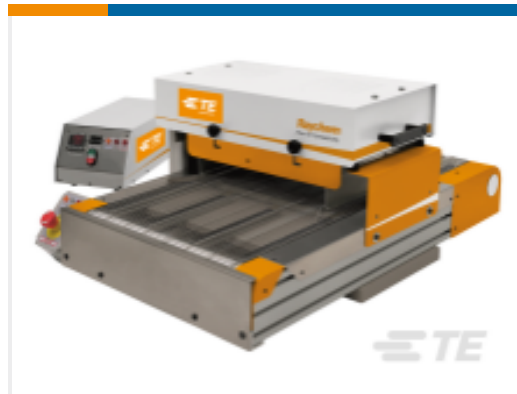
TE 产品编号 2326489-1 MODEL 105 TUNNEL OVEN, 36" ENTRY, STAND