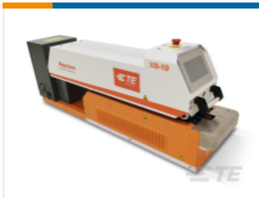
TE 产品编号 2375320-1 XB19 Belt Heater, STD