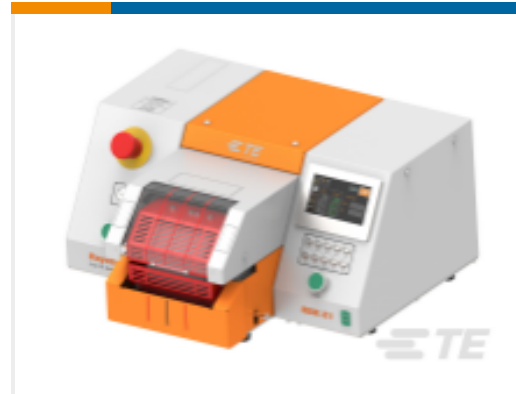
TE 产品编号 2234800-1 RBK-X1 STD