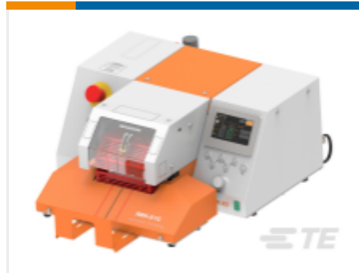
TE 产品编号 1-2376800-4 RBK-X1C CE, W/ AIR COOLING