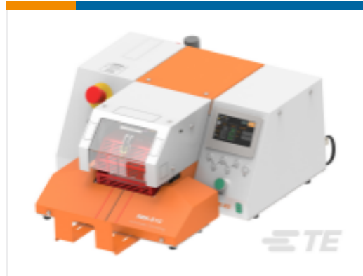
TE 产品编号 1-2376800-3 RBK-X1C, W/ AIR COOLING