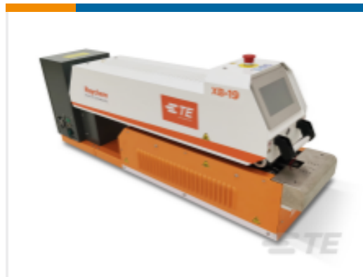
TE 产品编号 2375320-2 XB19 Belt Heater, 150mm (6") Version