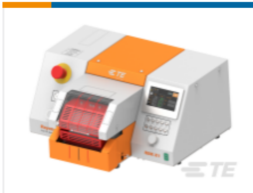
TE 产品编号 2234800-2 RBK-X1 CE STD