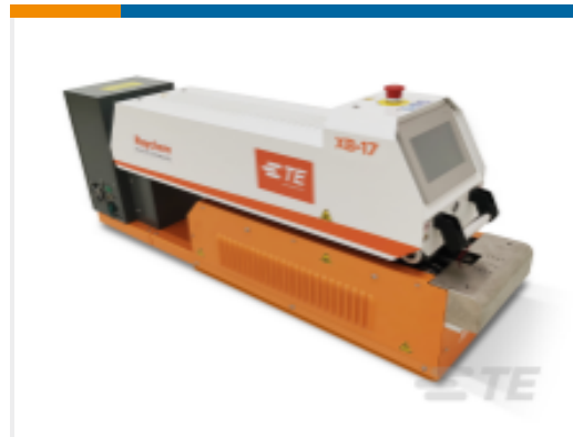
TE 产品编号 2375310-1 XB17 Belt Heater, 220V