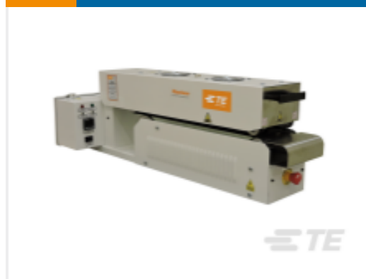
TE 产品编号 2280355-1 220 V MODEL 17