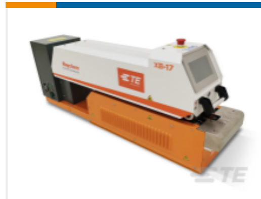
TE 产品编号 2375310-2 XB17 Belt Heater, 110V