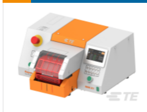
TE 产品编号 1-2234800-1 RBK-X1, AUTO TRIGGER