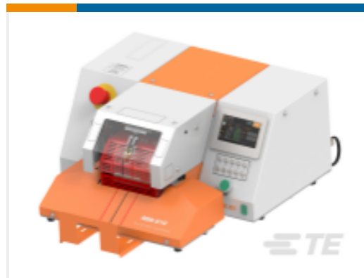
TE 产品编号 2376800-1 RBK-X1C STD