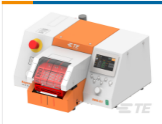
TE 产品编号 1-2234800-4 RBK-X1 CE, W/ AIR COOLING