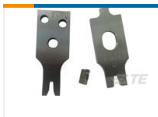
TE 产品编号7-2266125-7 OCEAN_2.0_SPARE_PART_KIT-117F134O