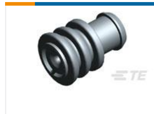
TE 产品编号828904-2 SINGLE WIRE SEAL FOR J.P.T.CON