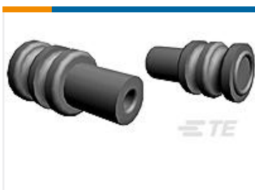
TE 产品编号963530-1 EINZELLEITERDICHTNG