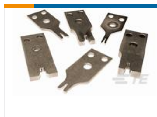
TE 产品编号8-654223-2 DRAHTCRIMPER