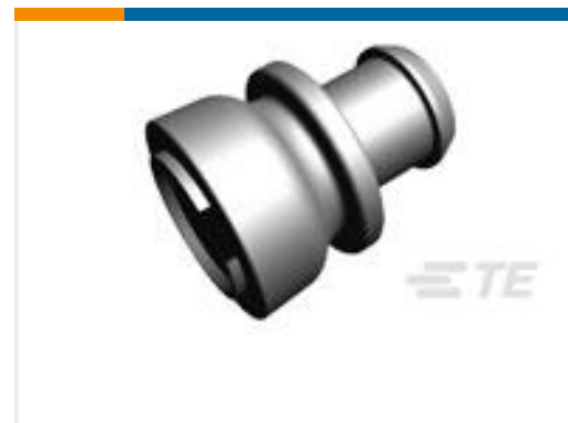
TE 产品编号828920-1 EINZELADERDICHTUNG