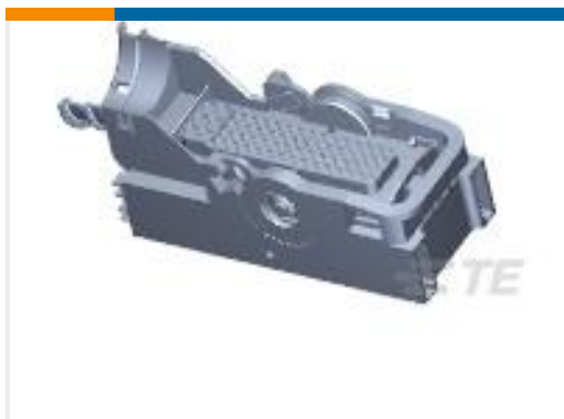
TE 产品编号1-1418883-1 62.POS.MIXED REC.HSG