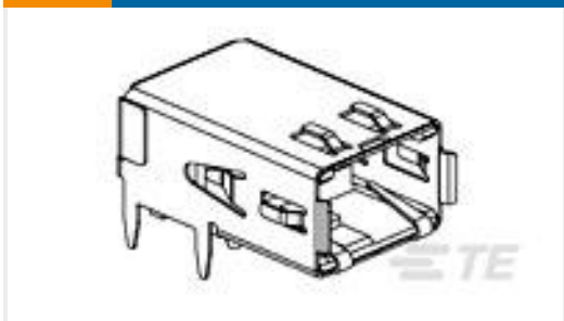
TE 产品编号1761072-3 RECPT,HSSDC2,FIBRE,TRAY PKG