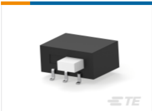
TE 产品编号1-1437581-1 ASE22RL=AUTOSLIDE DP