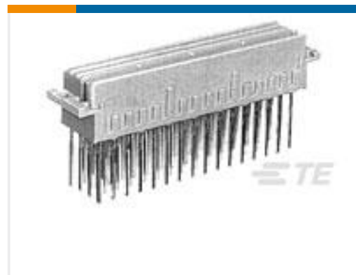
TE 产品编号167771-1 64P.IEC-G FEM.CONN.