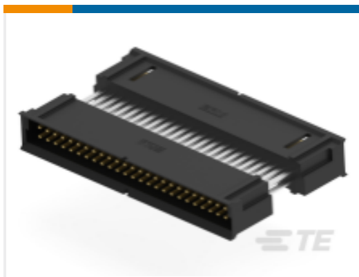
TE 产品编号354308-E DRCBTB 1,27 50 M BTB22 20,2 137 * 094 TR