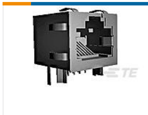
TE 产品编号1-406541-8 MJ,INV,1X1,0PNL G.,100"ST,SN