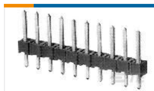
TE 产品编号826938-5 5P AMPMODU II STIFT LEI