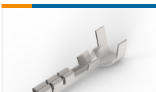
TE 产品编号175036-3 CONTACT REC 22-18 AWG 0.30 X 14.0 SS