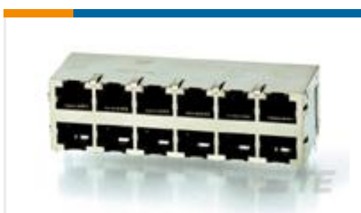
TE 产品编号1-1734473-1 RJ45, Multiport, Stacked, 25u" Ni, 6u" Au