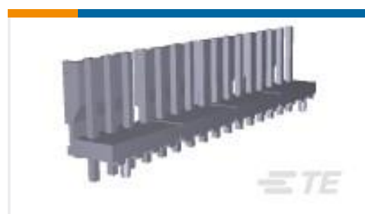
TE 产品编号4-644615-6 16P MTA156 POL HDR ASSY LF