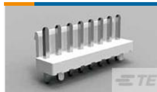
TE 产品编号2-1744057-7 3.96 EP HDR ASSY 7P W/PEGS, BLUE