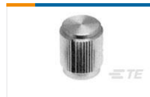
TE 产品编号6-1437622-0 KN700B1/4=KNOB BLACK KNURL 1/4