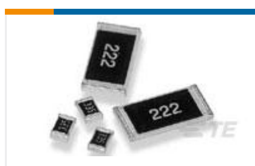
TE 产品编号1623257-1 CRG0805 1% 5K1