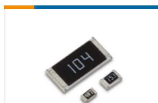
TE 产品编号4-2176339-7 CRGCQ 0603 68K 1%