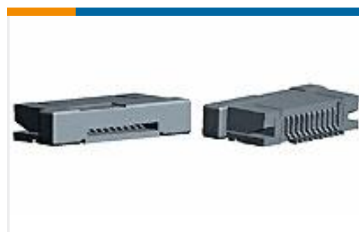
TE 产品编号5-1734592-0 FPC CONN. 0.5MM PITCH B/C, 50P