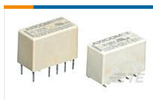
TE 产品编号7-1393788-1 V23079E1208B301