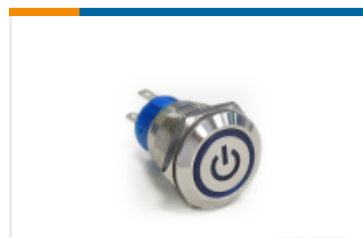
TE 产品编号5-2213766-7 AV19 DPM 3A POWER LED BLUE 12V