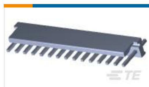
TE 产品编号1-644752-5 15P MTA156 HDR ASSY SQ STR F/L