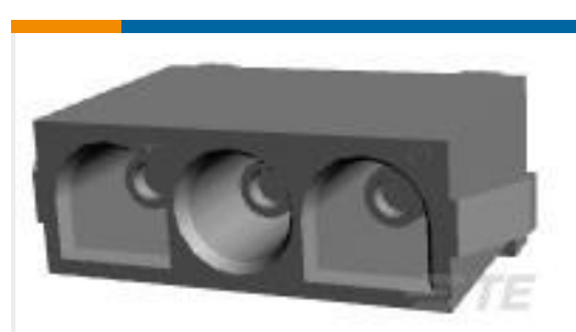
TE 产品编号350760-4 03P UMNL HDR ASSY PC