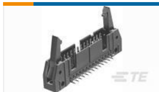
TE 产品编号5102322-8 A/L UNIV HDR 34P RA LG LAT