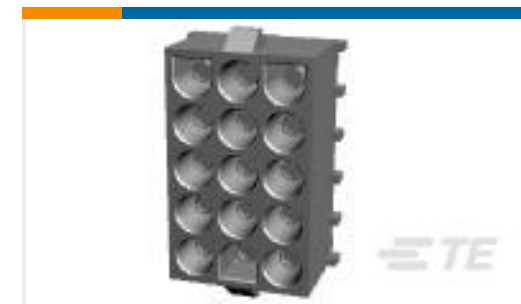
TE 产品编号350765-5 15P UMNL HDR ASSY PC LF