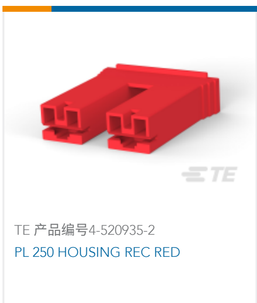
TE 产品编号4-520935-2 PL 250 HOUSING REC RED