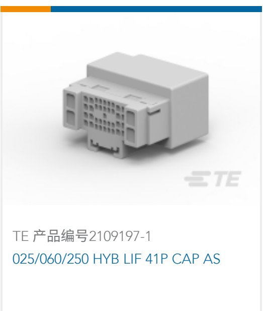
TE 产品编号2109197-1 025/060/250 HYB LIF 41P CAP AS