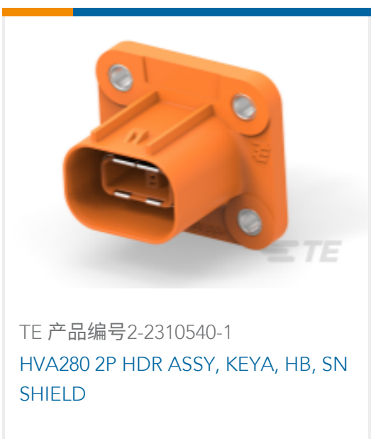
TE 产品编号2-2310540-1 HVA280 2P HDR ASSY, KEYS, HB, SN SHIELD