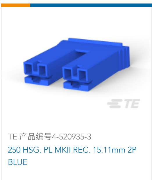
TE 产品编号4-520935-3 250 HSG. PL MKII REC. 15.11mm 2P BLUE