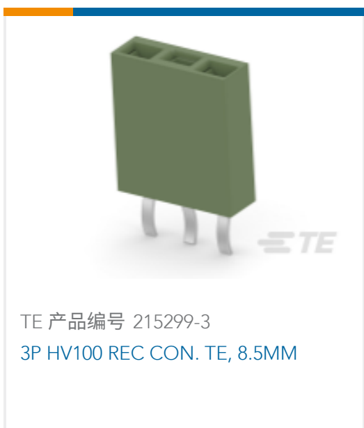
TE 产品编号 215299-3 3P HV100 REC CON. TE, 8.5MM