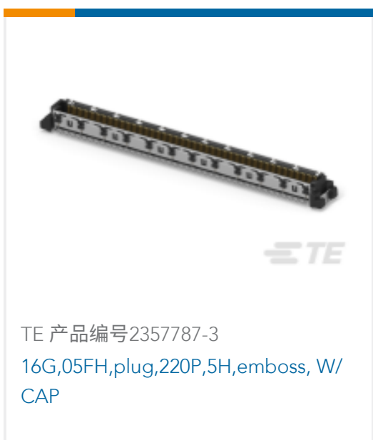
TE 产品编号2357787-3 16G,05FH,plug,220P,5H,emboss, W/ CAP