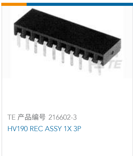
TE 产品编号 216602-3 HV190 REC ASSY 1X 3P