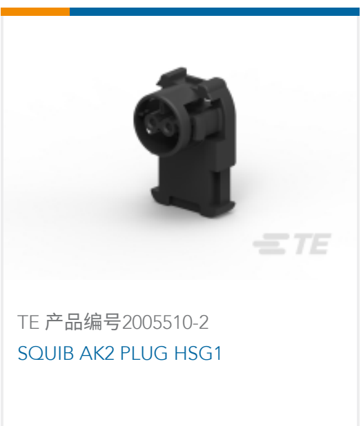
TE 产品编号2005510-2 SQUIB AK2 PLUG HSG1