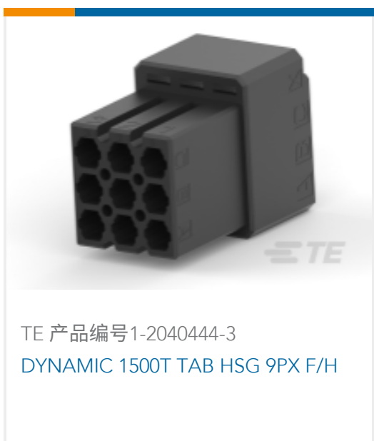
TE 产品编号1-2040444-3 DYNAMIC 1500T TAB HSG 9PX F/H