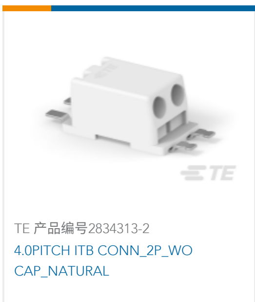
TE 产品编号2834313-2 4.0PITCH ITB CONN_2P_WO CAP_NATURAL