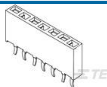
TE 产品编号 215297-2 2P HV100 REC CON. TE, 7.0MM