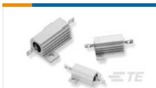
TE 产品编号1-1879071-5 THS50 2R0 5%