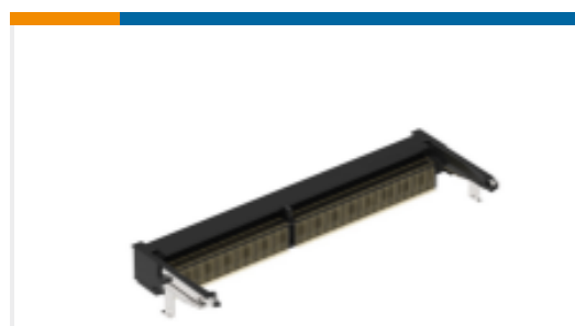
TE 产品编号2309414-1 DDR4 SODIMM 260P 9.2H RVS