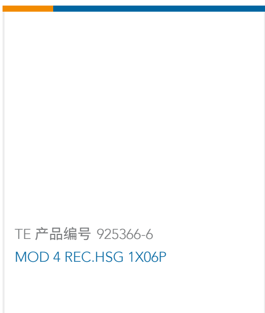
TE 产品编号 925366-6 MOD 4 REC.HSG 1X06P