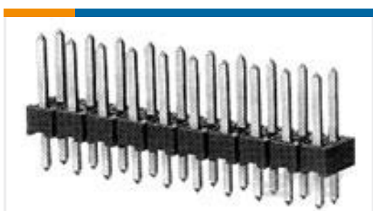
TE 产品编号826656-2 2P AMPMODU II STIFT LEI