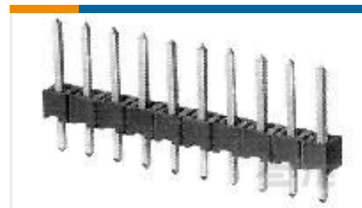
TE 产品编号826629-6 06P AMPMODU II PIN HDR.