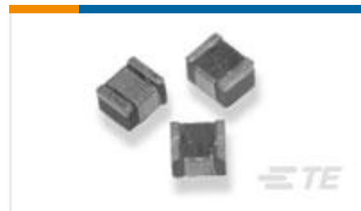
TE 产品编号7-1624112-5 3650 0603 15nH 5% 2K RL