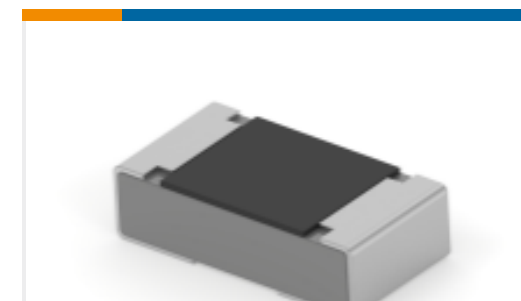
TE 产品编号2-2176481-4 RA73F 1J 10K2 0.1% 5K RL