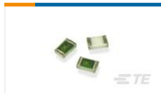
TE 产品编号1676259-2 RN 0805 232R 0.1% 10PPM 1KRL