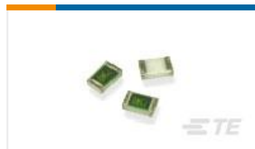
TE 产品编号1676342-2 RN 0805 442R 0.1% 10PPM 1KRL