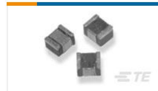
TE 产品编号1624112-5 3650 0603 33nH 5% 2K RL