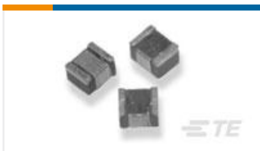
TE 产品编号1-1879023-1 3650 1008 47nH 5% 2K RL