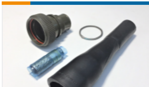
TE 产品编号104739-000 5428-12-441116