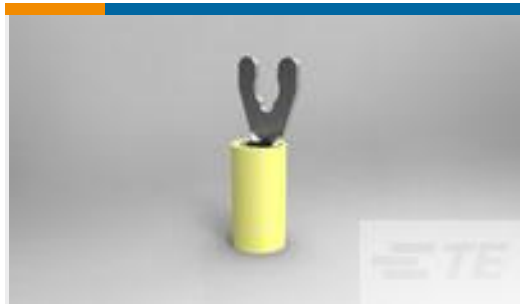
TE 产品编号8-52942-1 TERMINAL,PIDG SPR SPD 12-10 8