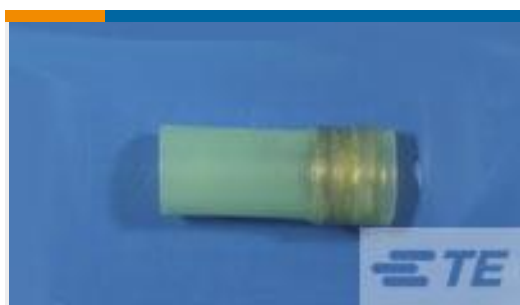
TE 产品编号307416N001 D-150-1010CS821