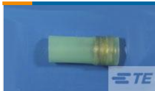
TE 产品编号528006N001 D-150-1006CS821