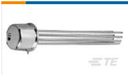
TE 产品编号1617163-7 JMACDD-26XM = M39016/20-054M