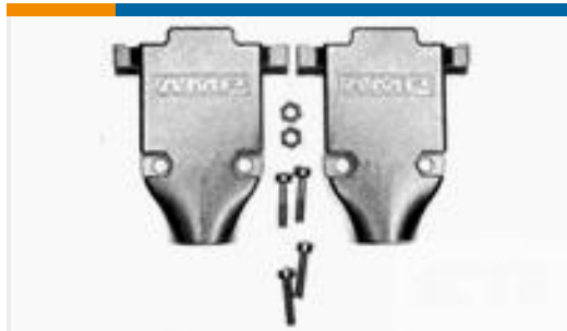
TE 产品编号5745173-5 CABLE CLAMP KIT,SZ 3